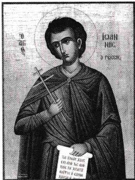
Sfântul Ioan Rusul